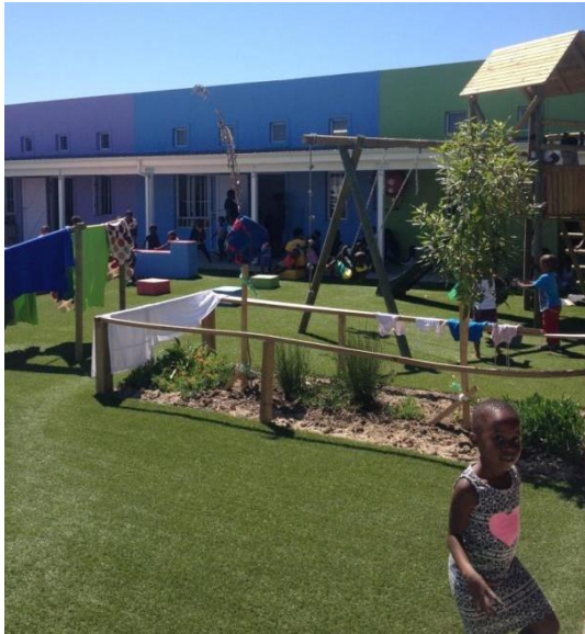
Lisa Educare Centre

Noto, heeft zich goed hersteld na een ernstige ziekte.